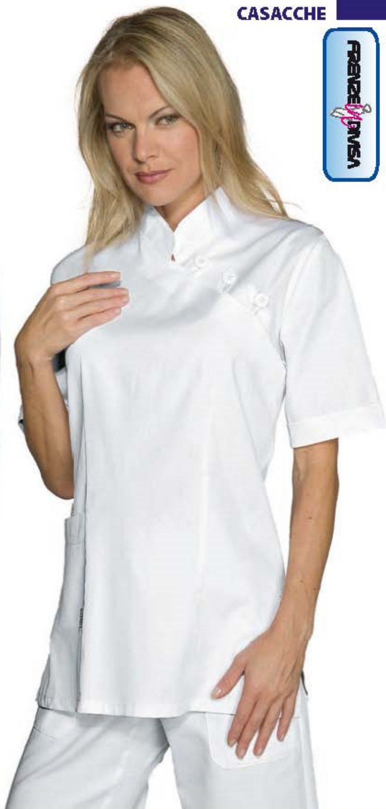
002500 CASACCA TAIPEI MEZZA MANICA half sleeve Halbarm demie manche manga corta BIANCO