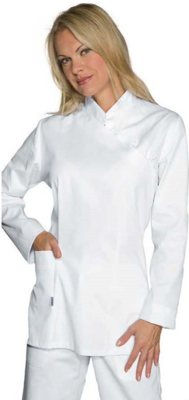
002400 CASACCA TAIPEI 100% cotton 190 gr/m 2 S • M • L • XL • XXL BIANCO