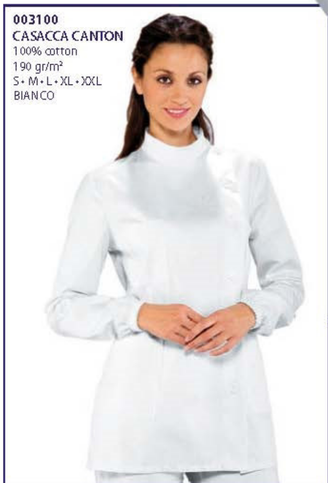
003100 CASACCA CANTON 100% cotton 190 gr/m 2 S • M • L • XL • XXL BIANCO