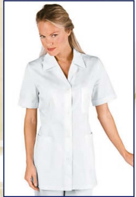
031309 CASACCA GINEVRA MEZZA MANICA 100% cotton satin 180 gr/m 2 S • M • L • XL • XXL BIANCO

SATIN, PER CHI VUOLE IL COTONE MA NON SI ACCONTENTA SATIN, FOR THOSE WHO WANT COTTON BUT AT THE SAME TIME WANT MORE