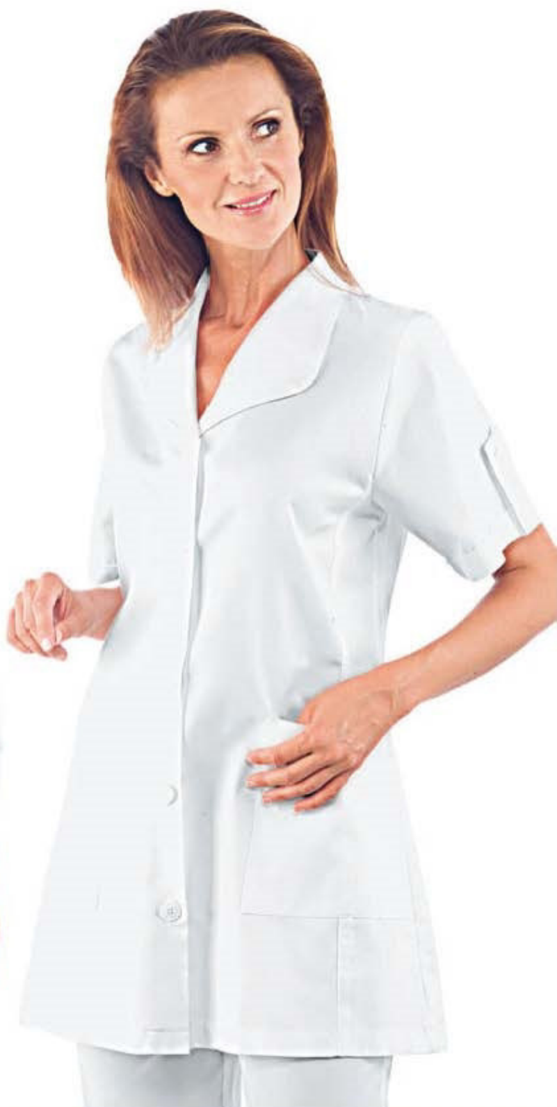
050300 PASADENA MANICA LUNGA 100% cotton 190 gr/m 2 S • M • L • XL • XXL BIANCO