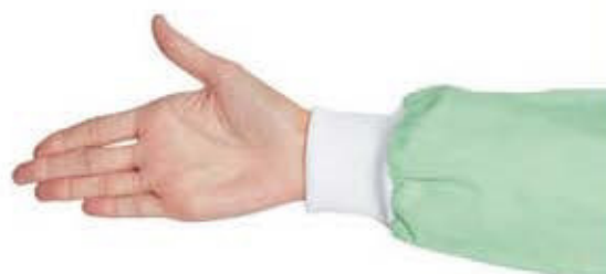
130900 COPPIA POLSI IN MAGLIA BIANCO