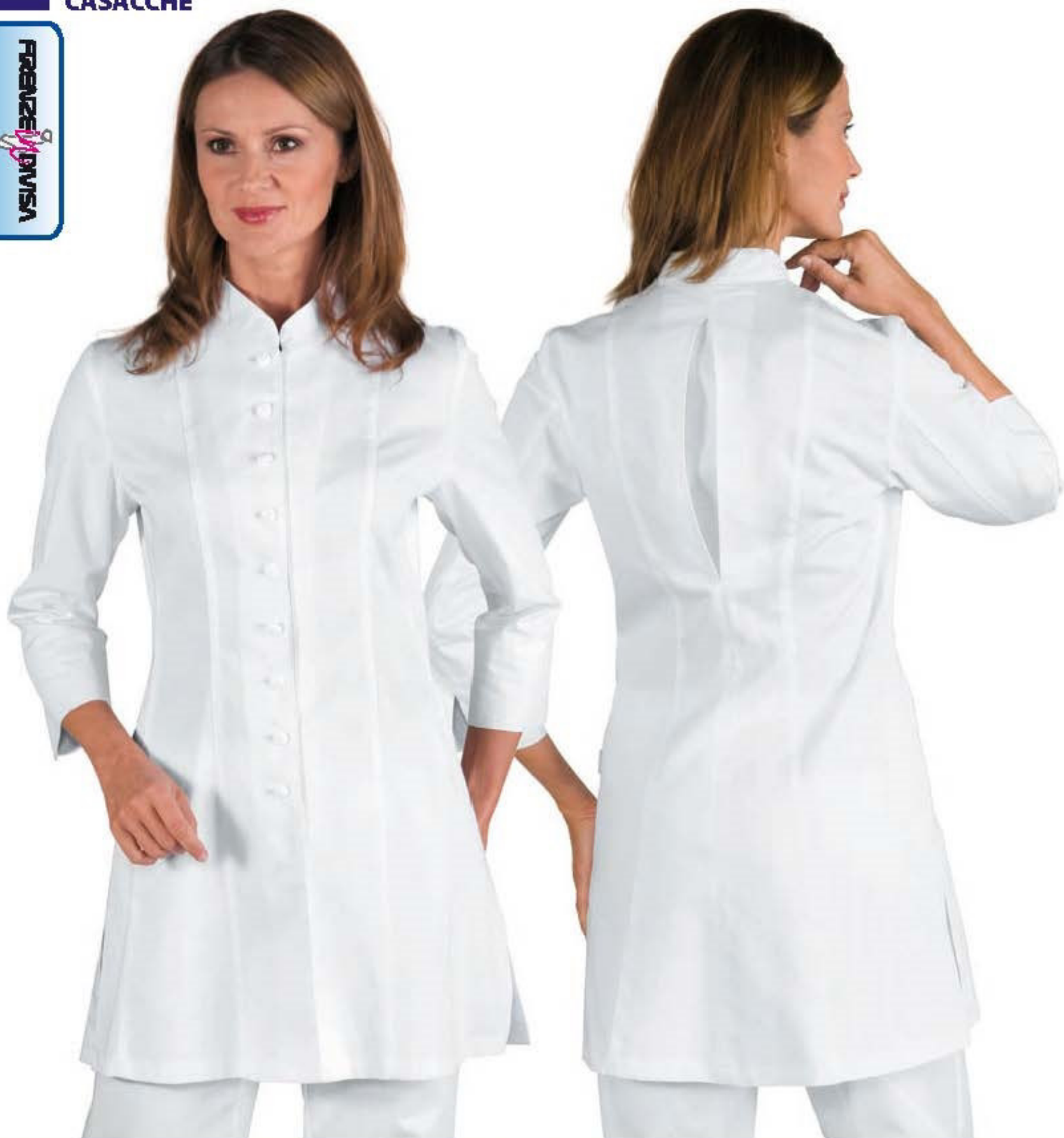
016500 CASACCA SIVIGLIA 100% cotton 190 gr/m 2 S • M • L • XL • XXL BIANCO