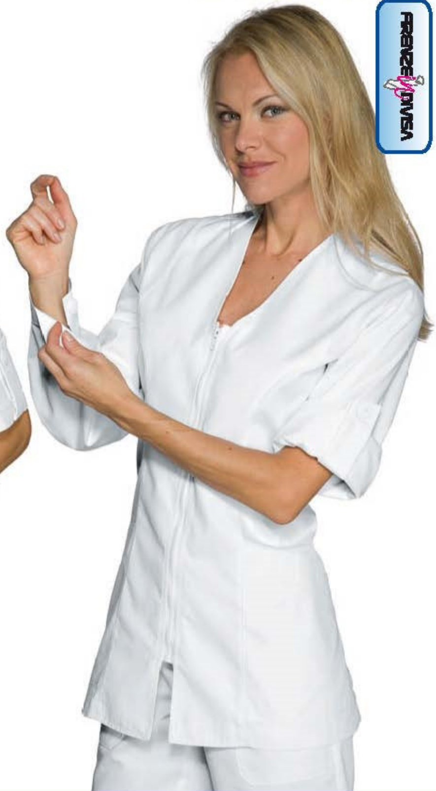
015200 CASACCA BENIDORM MEZZA MANICA half sleeve Halbarm demie manche manga corta BIANCO