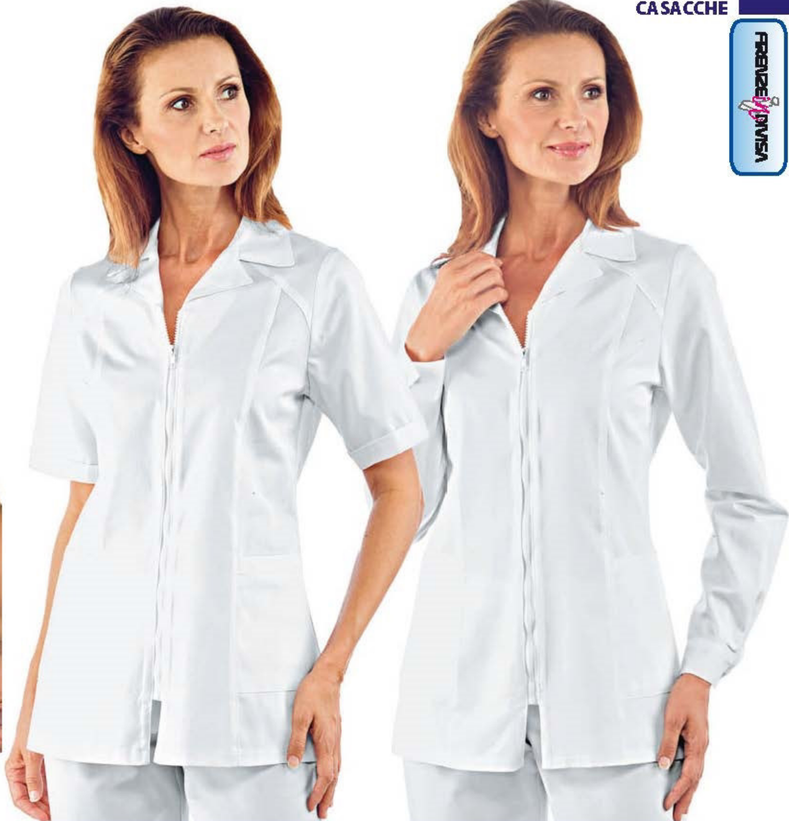
003400 CASACCA BARCELLONA MEZZA MANICA half sleeve Halbarm demie manche manga corta BIANCO