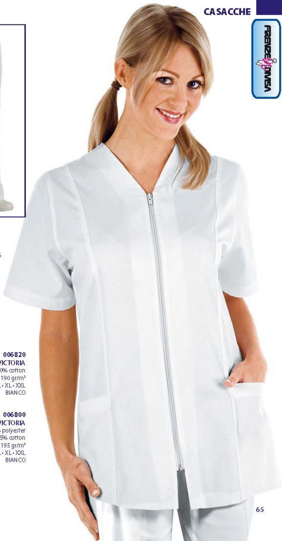
006800 CASACCA VICTORIA 65% polyester 35% cotton 195 gr/m 2 S • M • L • XL • XXL BIANCO