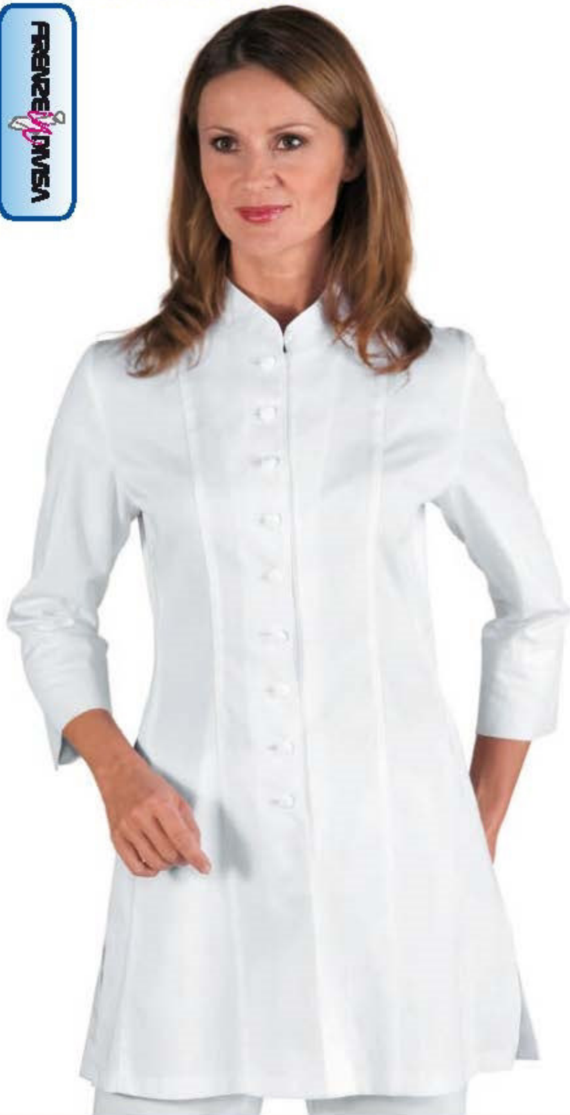
016500 CASACCA SIVIGLIA 100% cotton 190 gr/m 2 S • M • L • XL • XXL BIANCO