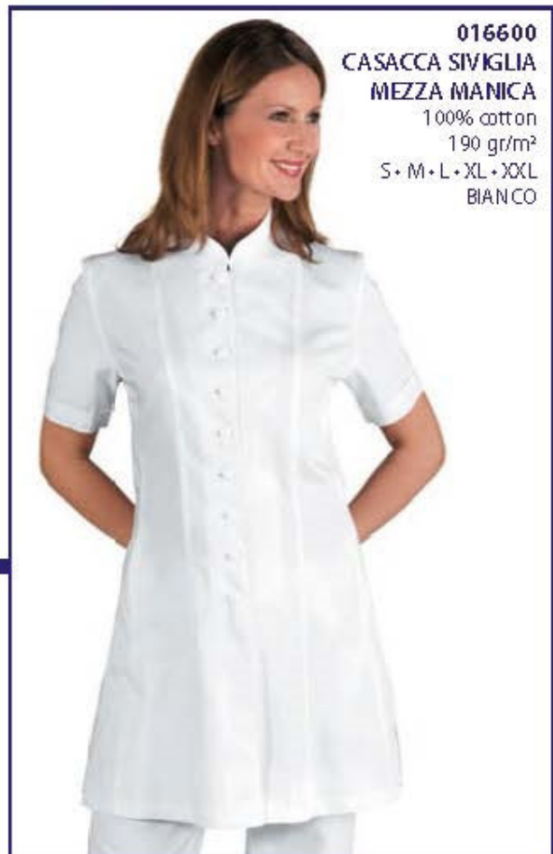
016600 CASACCA SIVIGLIA MEZZA MANICA 100% cotton 190 gr/m 2 S • M • L • XL • XXL BIANCO