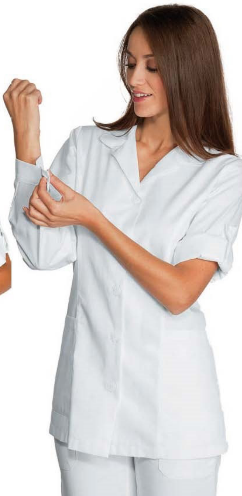
012107 CASACCA ODESSA MEZZA MANICA half sleeve Halbarm demie manche manga corta BIANCO