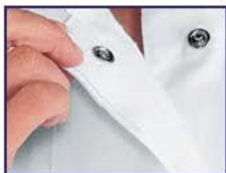
BOTTONI A PRESSIONE