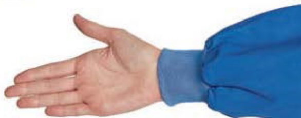
130906 COPPIA POLSI IN MAGLIA AZZURRO