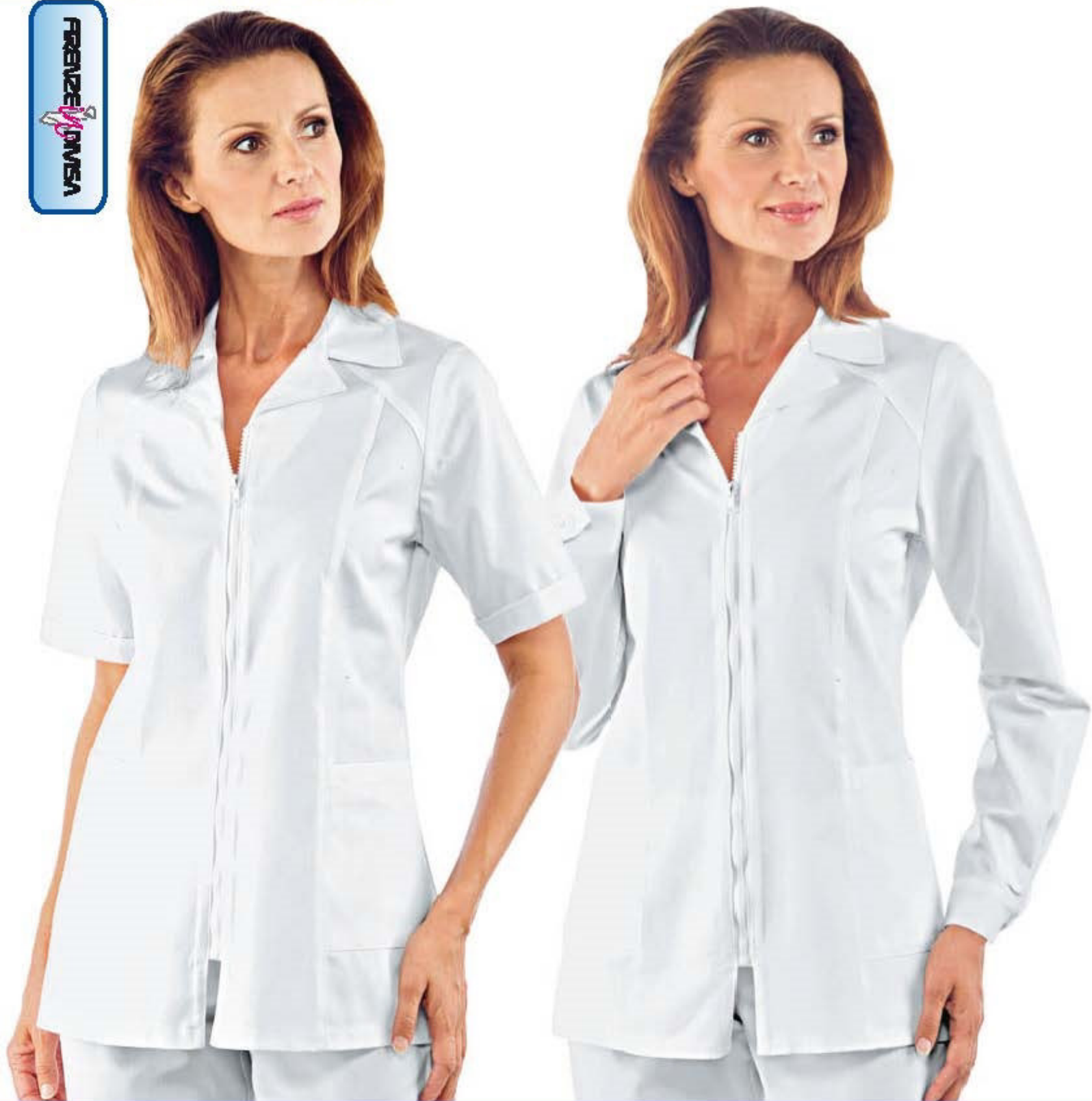
003400 CASACCA BARCELONA MEZZA MANICA half sleeve Halbarm demi manche manga corta BIANCO