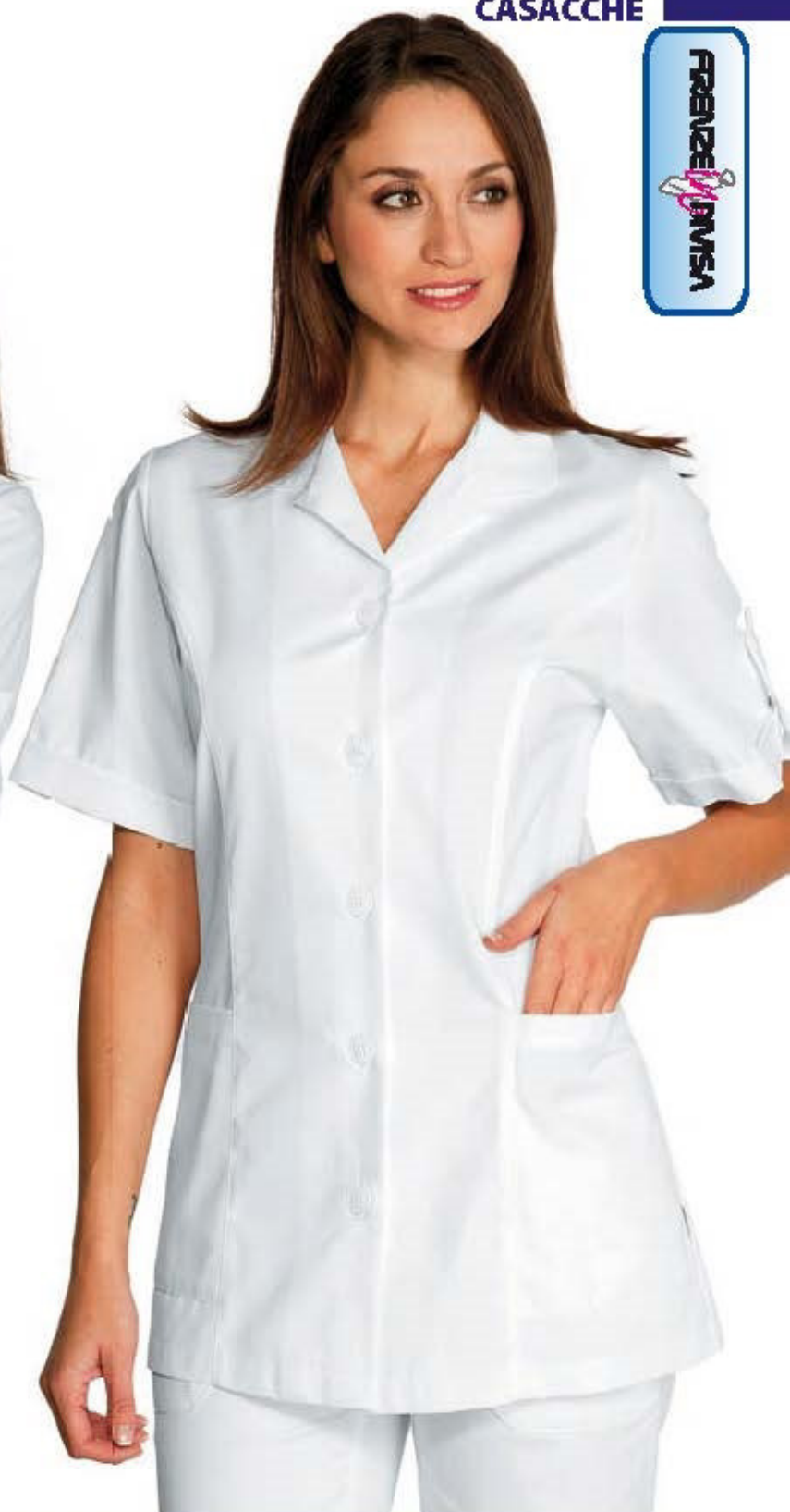
012107 CASACCA ODESSA MEZZA MANICA half sleeve Halbarm demie manche manga corta BIANCO