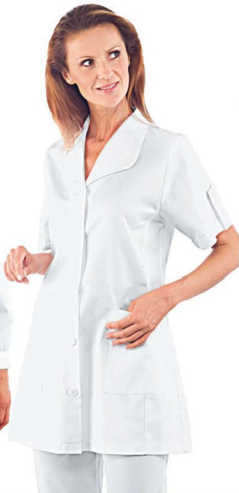
050300 PASADENA MANICA LUNGA 100% cotton 190 gr/m 2 S • M • L • XL • XXL BIANCO