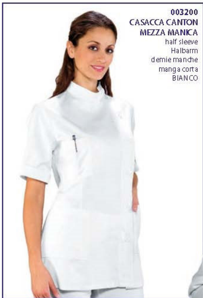
003200 CASACCA CANTON MEZZA MANICA half sleeve Halbarm demie manche manga corta BIANCO