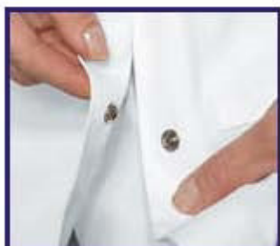
BOTTONI A PRESSIONE