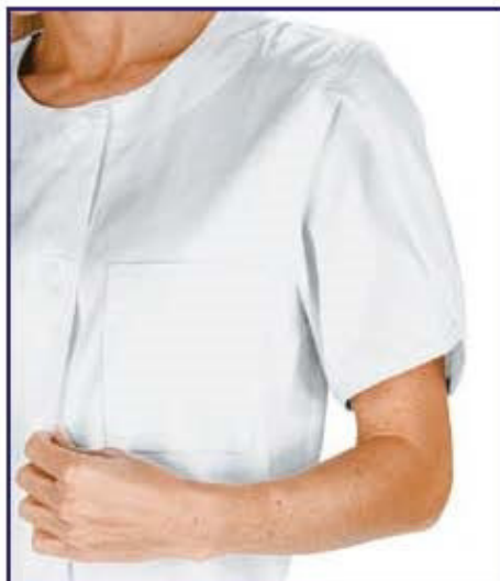
MANICA CHE FACILITA IL MOVIMENTO

019200 CASACCA ALBERVILLE 100% cotton 190 gr/m 2 S • M • L • XL • XXL BIANCO