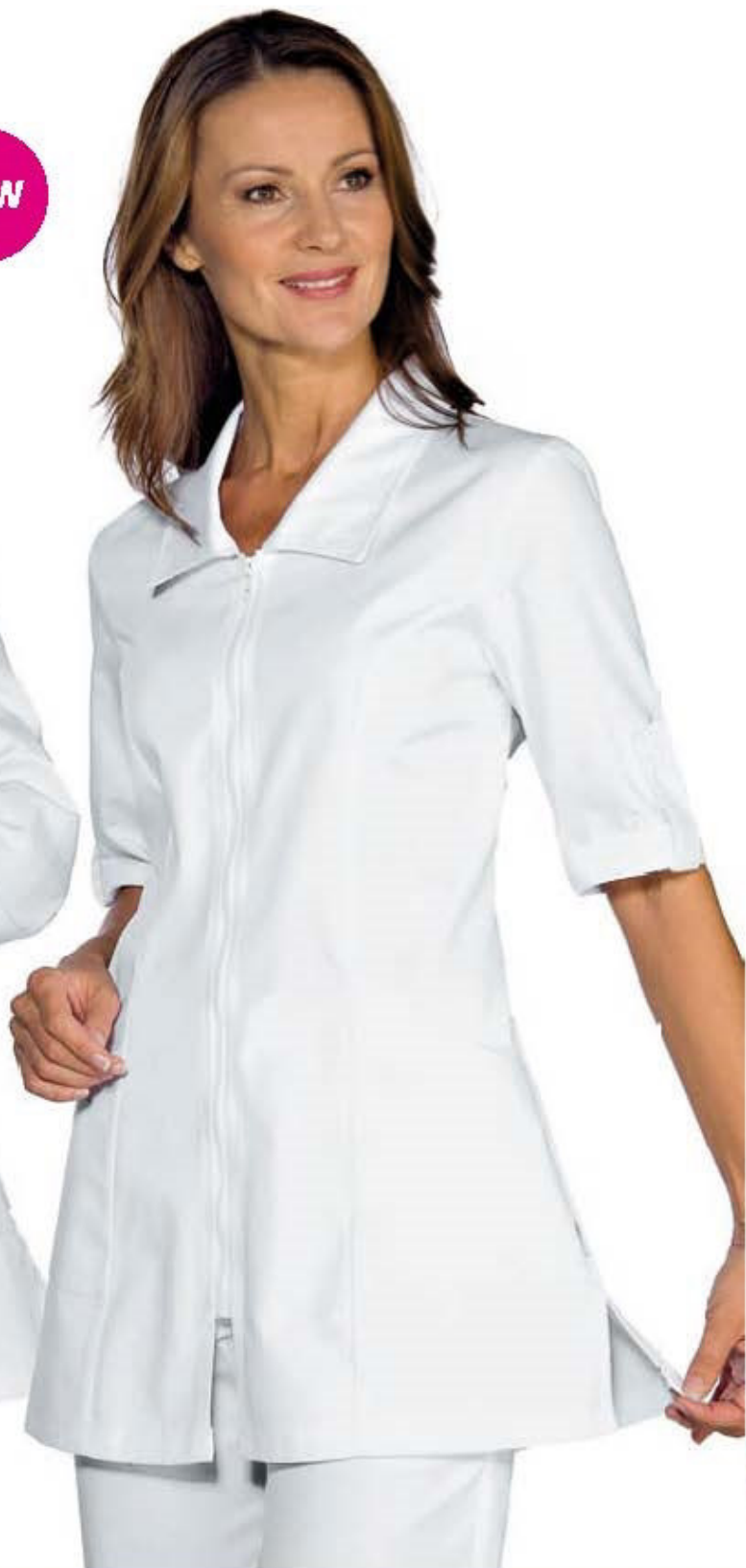
002100 CASACCA TORTOLA 65% polyester 35% cotton 195 gr/m 2 S • M • L • XL • XXL BIANCO