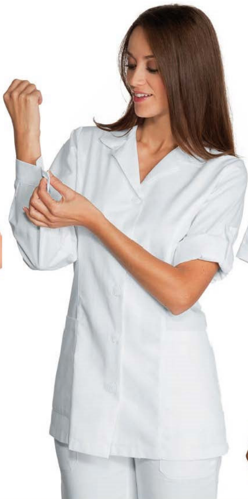
012007 CASACCA ODESSA 65% polyester 35% cotton 195 gr/m 2 S • M • L • XL • XXL BIANCO