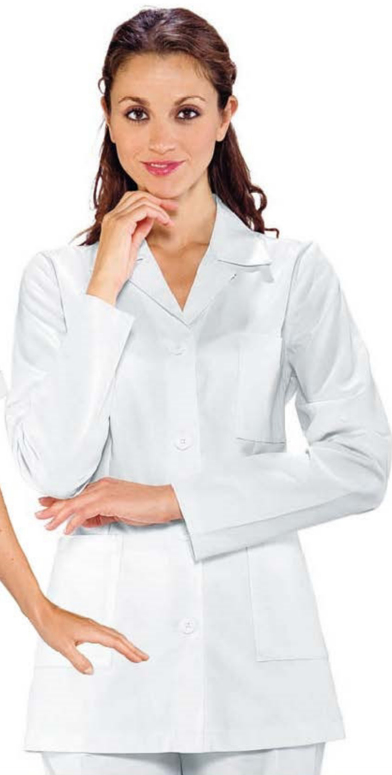
031300 CASACCA GINEVRA MEZZA MANICA 100% cotton 190 gr/m 2 S • M • L • XL • XXL BIANCO