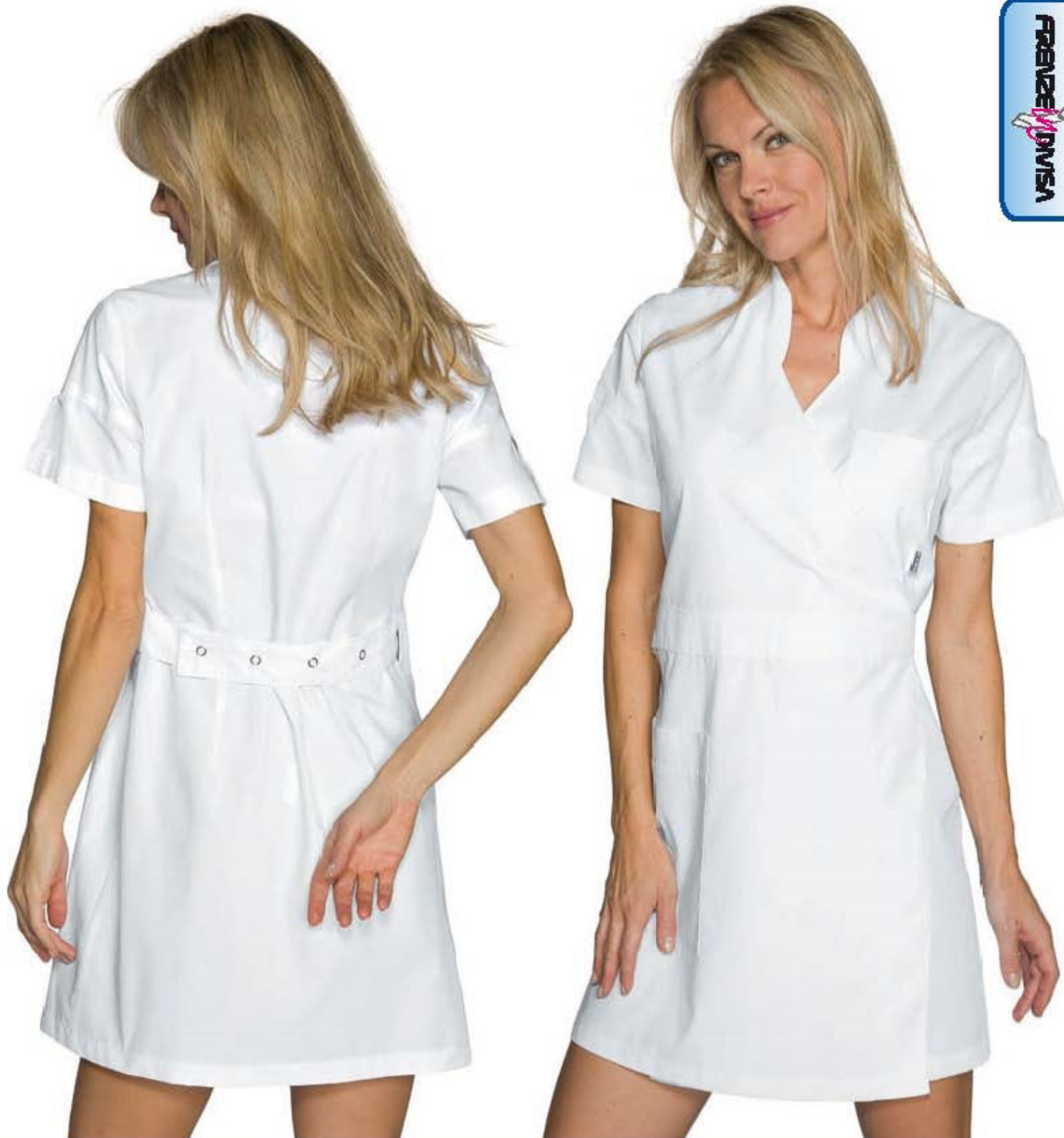
005900 KIMONO SEOUL 65% polyester 35% cotton 150 gr/m 2 M • XL BIANCO