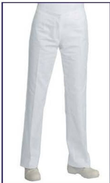
024200 PANTALONE TRENDY 100% cotton 210 gr/m 2 40 • 42 • 44 • 46 • 48 • 50 • 52 • 54 • 56 BIANCO