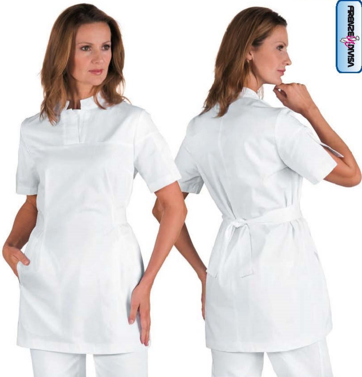
007500 CASACCA CIPRO 100% cotton 190 gr/m 2 S • M • L • XL • XXL BIANCO